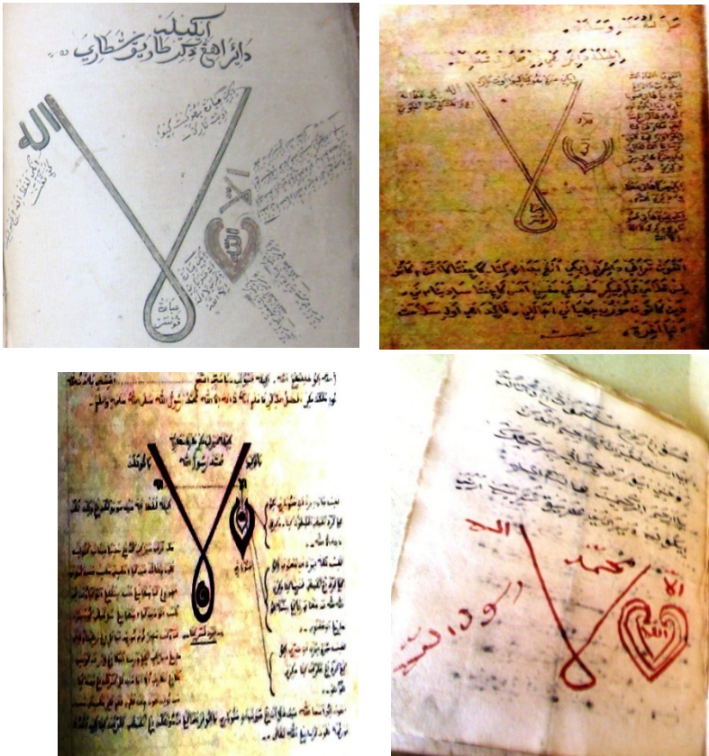
Gambar 2. Putaran Zikir Syatariyah Cirebon dari naskah Cirebon

Hal serupa juga terjadi pada lafal Lam Alif dalam gambar putaran zikir dan wirid Syatariyah di Cirebon sebagai berikut: