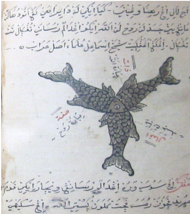
Gambar 1. Iwak telu sirah sanunggal dalam naskah SWM hlm. 26